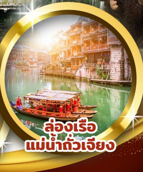
ล่องเรือ แม่น้ำตัวเจียง